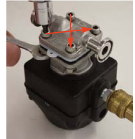
Tableau des couples de serrage du corps de vanne sur l'actionneur

10. Mettez l'actuateur pneumatique en position "fermé" à l'aide de l'air comprimé. Serrez les fixations de l'actuateur en quinconce. Procédez en plusieurs passes en quinconce pour atteindre le couple final indiqué dans le tableau. Refaites des passes supplémentaires en quinconce jusqu'à obtenir les valeurs finales du tableau pour serrer régulièrement chaque fixation à 5% de la valeur de couple. Si la membrane présente visuellement une compression régulière tout autour (sous forme de petit boudin), celle-ci a été correctement effectuée.